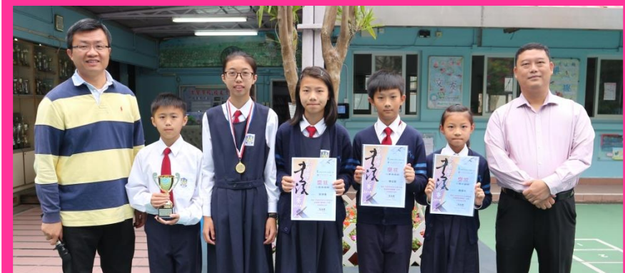
香港學界書法比賽