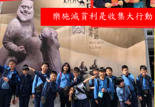
北參觀綿互萬里— 世界遺產絲綢之路展覽