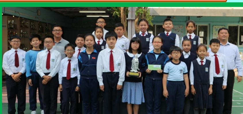
IPAD 遊蹤 2018