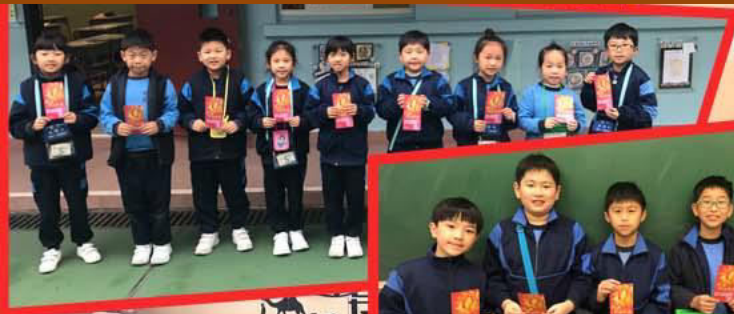
樂施減貧利是收集大行動