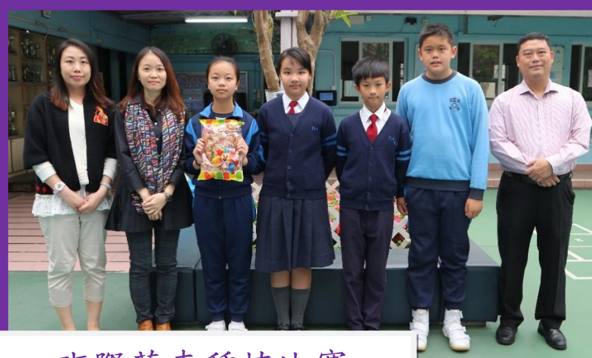
班際花卉種植比賽