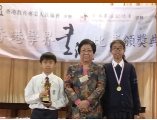
香港學界書法比賽