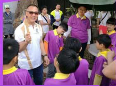
大埔區少年警訊 「通識少年園」