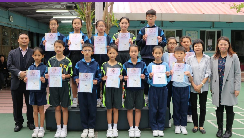
第十二屆滬港「寫作小能手」現場作文邀請賽