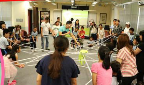
「全心傳意」親子工作坊