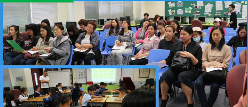
數學公開課 (三年級)