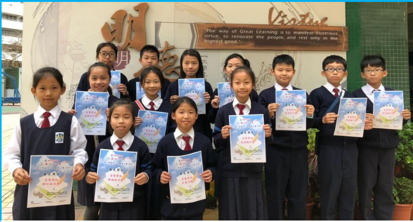
全港微型小說續寫比賽