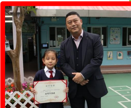
2018 深圳少兒春晚 (喜迎新春文藝滙演)