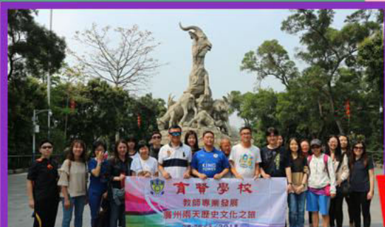
教師發展日 (廣州歷史文化之旅)