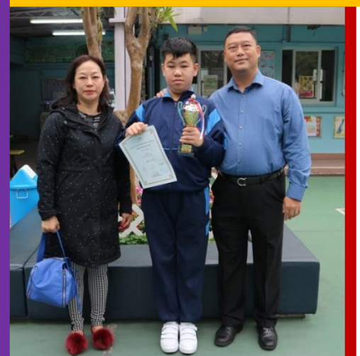
藝進盃全港十八區音樂大