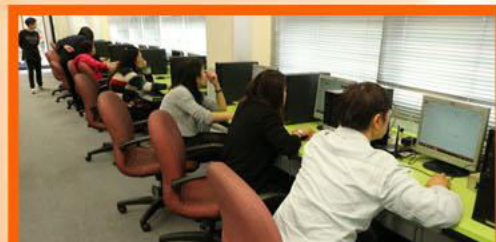
「電子簡報 (PowerPoint)」 家長工作坊