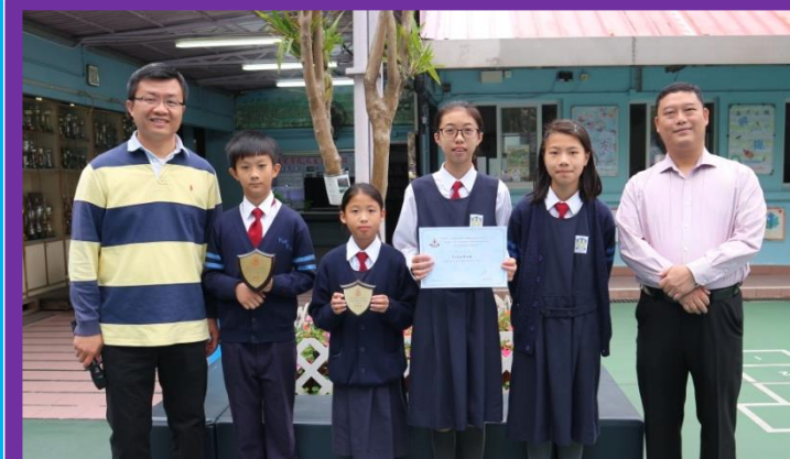
第四屆馬振玉文藝菁英賽-中英文硬筆書法比賽