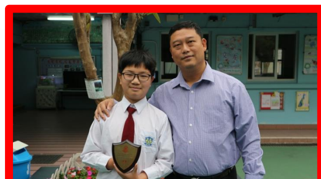
第四屆馬振玉文藝菁英賽普-通話演講比