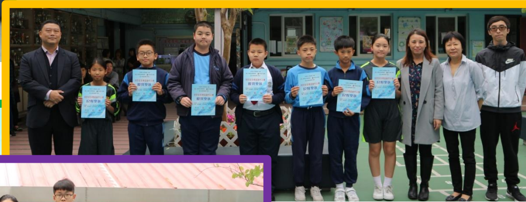
消防安全標語創作比賽