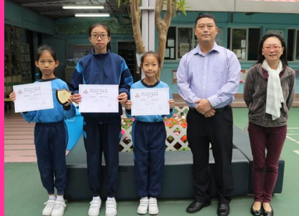
第四屆馬振玉文藝菁英賽-填色比賽