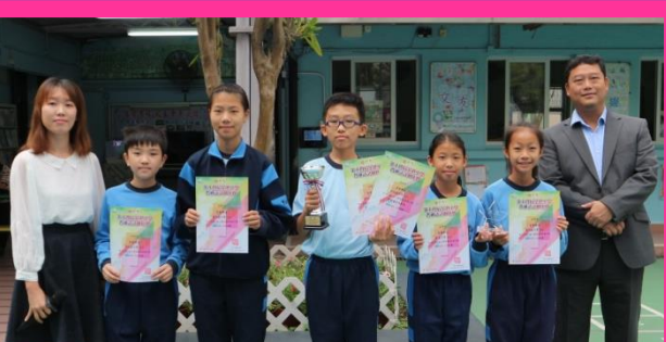
第十四屆全港小學普通話話劇比賽