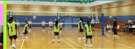
北區小學校際排球比賽