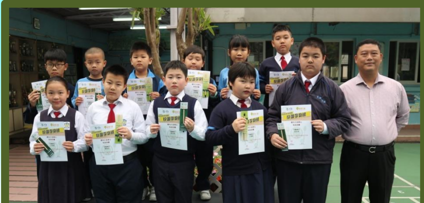
校園零廚餘計劃-最有衣食學生