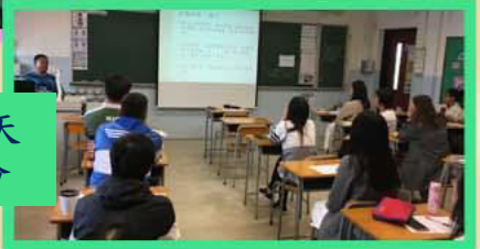
「教師發展日-廣州兩天 歷史文化之旅」簡介會