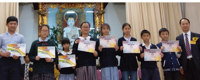
第四屆「細味人生 - 關愛有禮、熱心服務」硬筆書法比賽