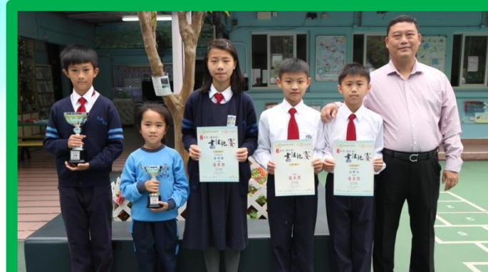
第二屆全港《基本法》書法比賽