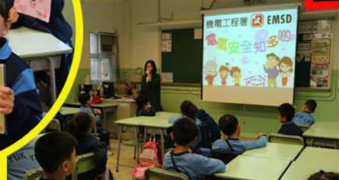
機電安全・從小做起講座