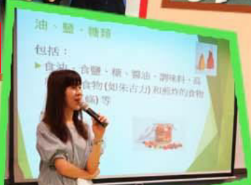
「至營父母」 家長講座