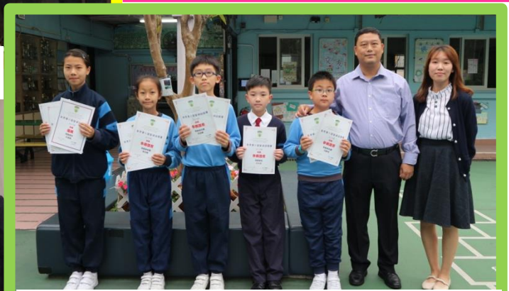
新界東小學普通話競賽