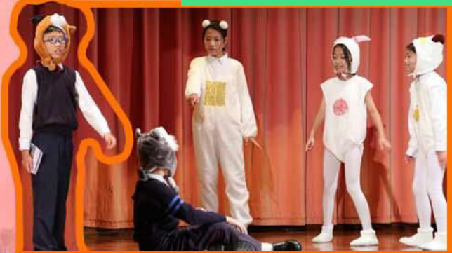
第十四屆全港小學普通話話劇比賽