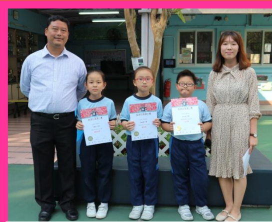
第二十屆全港中小學 普通話演講比賽(初賽)