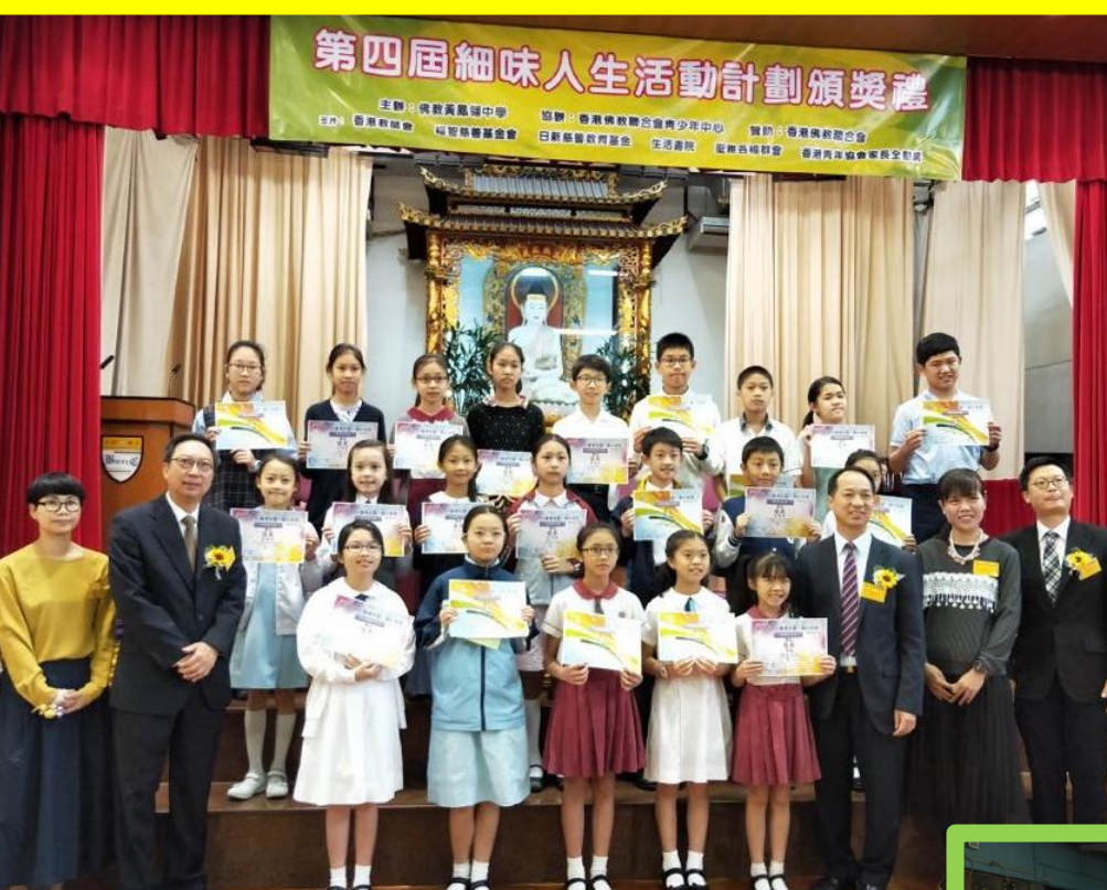
「細味人生——故事續作」頒獎典禮