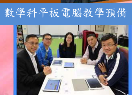
數學科平板電腦教學預備