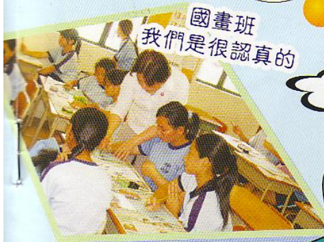
國畫班 我們是很認真的