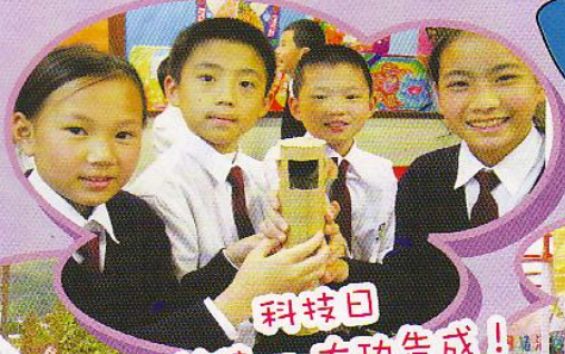
科技日 潛望鏡一大功告成！