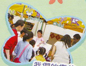
我們的攤位多熱鬧