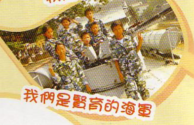
我們是賢育的海軍