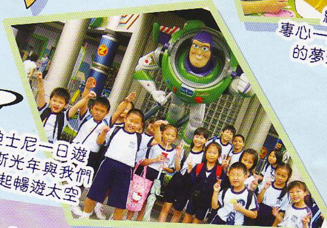
迪士尼一日遊 巴斯光年與我們一起暢遊太空