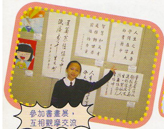
參加書畫展，互相觀摩交流