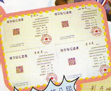
六位同學榮獲第八屆文華杯全國硬筆書法比賽榮譽證書