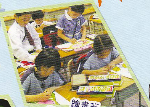
繪畫班 專心一致，把我們的夢想畫出來