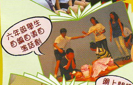
六年級學生 自編自導自 寫話劇