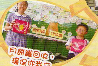
月餅罐回收-環保你我守