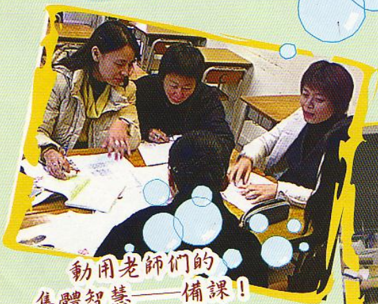
動用老師們的集體智慧——備課！