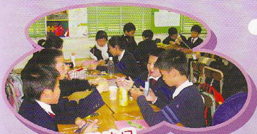
科技日 我們把課室變作實驗室