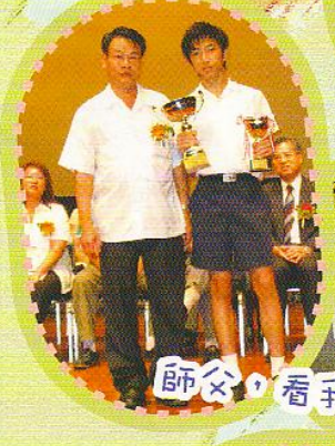
師父，看我有多醒目！