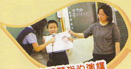
快來聽聽我的演講