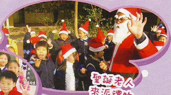
聖誕老人 來派禮物