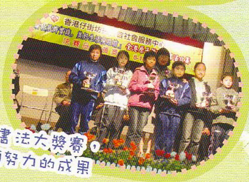
參加書法大獎賽，盡顯努力的成果