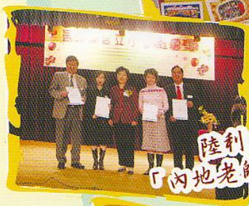
陸利基校長領取「內地老師交流計畫」證書