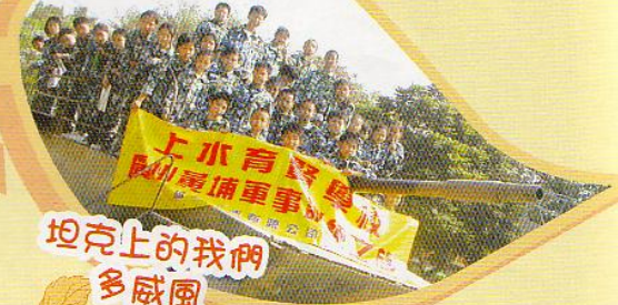
坦克上的我們多威風