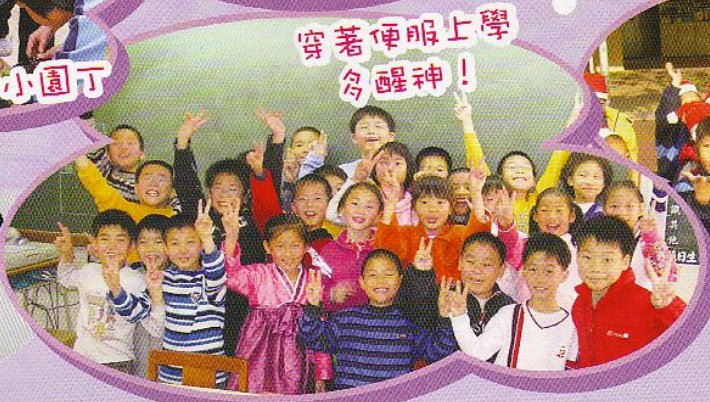
穿著便服上學 為醒神！