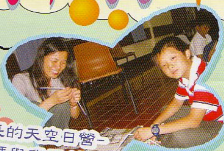
成長的天空日營-媽媽與我同創作