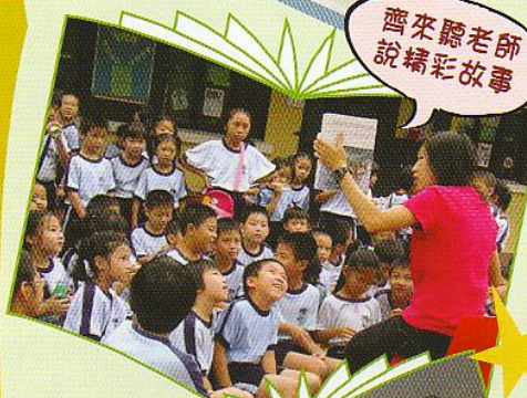
齊來聽老師 說精彩故事