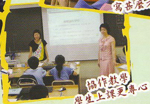
協作教學 學生上課更專心