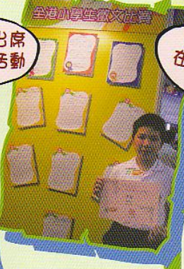
學生踴躍出席 語文交流活動