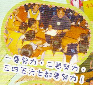
一要努力，二要努力，三四五六七都要努力！