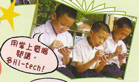
用掌上電腦 閱讀， 多Hi-tech!