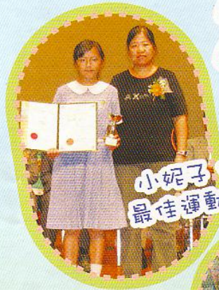
小妮子，勇奪最佳運動員殊榮