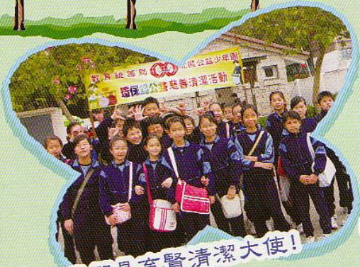
我們是育賢清潔大使!