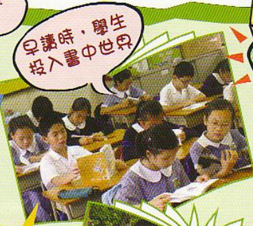
早讀時，學生 投入書中世界