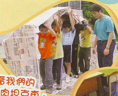
看我們的「人肉坦克車」