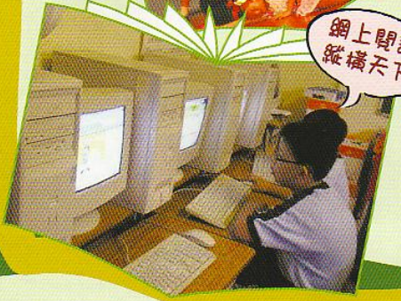
網上閱讀 縱橫天下