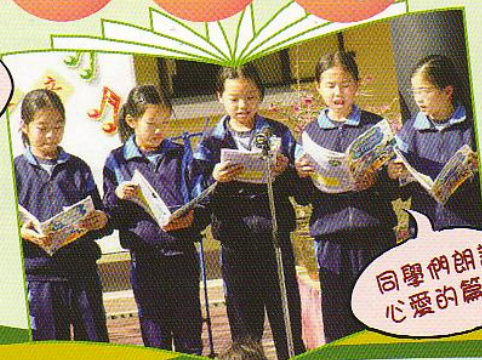
同學們朗讀 心愛的篇章