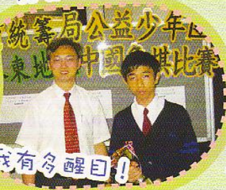
統籌局公益少年團 東地中國象棋比賽