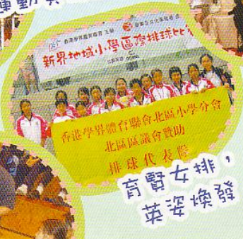
新界地域小學區際排球比賽 香港學界體育聯合會北區小學分會 北區區議會贊助 排球代表隊 育賢女排，英姿煥發