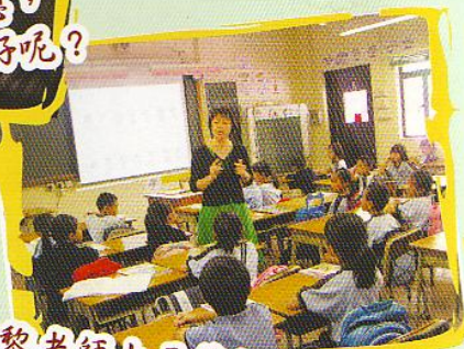
黎老師上示範課 學生多乖