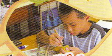
中國四大發明-我是現代畢昇