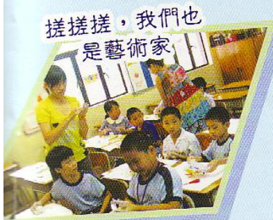
搓搓搓，我們也是藝術家