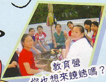
教育營 你也想來燒烤嗎？