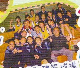
育賢校隊馳騁籃球場