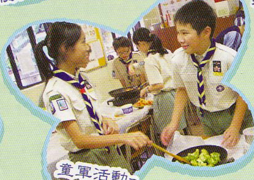
童軍活動-齊來學烹飪