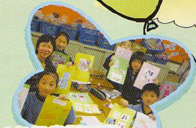
2年級專題研習-「為我們服務的人」