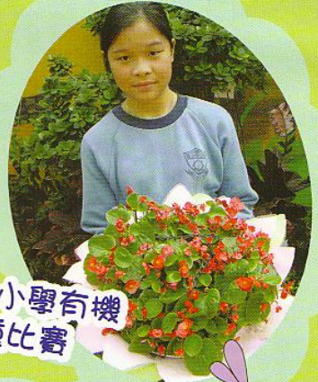
全港中小學有機耕種比賽