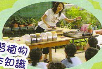
學習植物基本知識