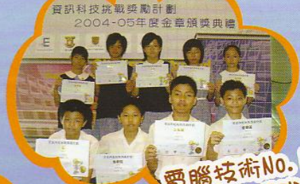
資訊科技挑戰獎勵計劃 2004-05年度金章頒獎典禮