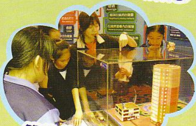
節約能源由我做起