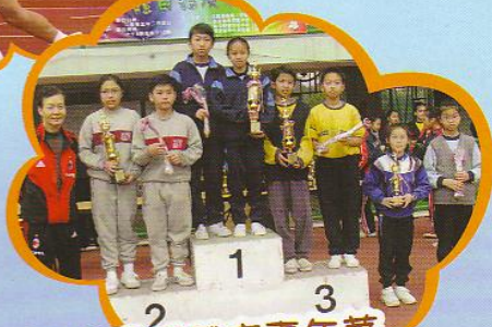
再次場感體育嘉年華