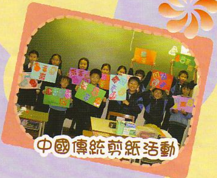
中國傳統剪紙活動