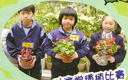
秋海棠種植比賽得獎作品