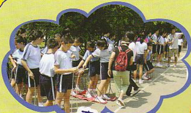
齊心合力、 共創佳績