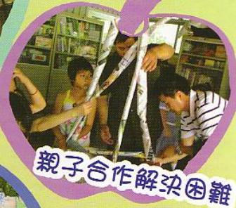
親子合作解決困難