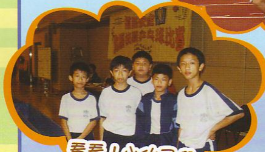
看看！小伙子們 多麼威風、多麼神氣