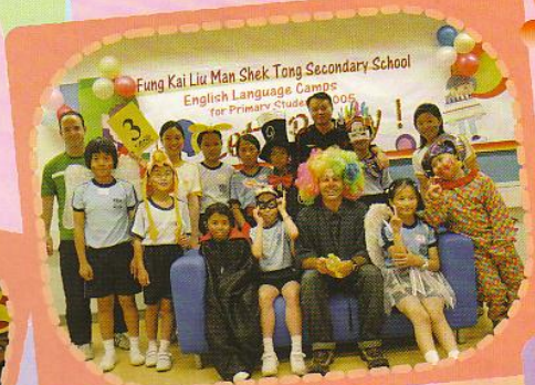
英語日營及英文活動日