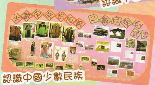
認識中國少數民族