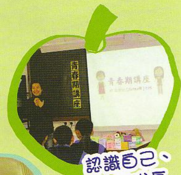
認識自己、快樂成長