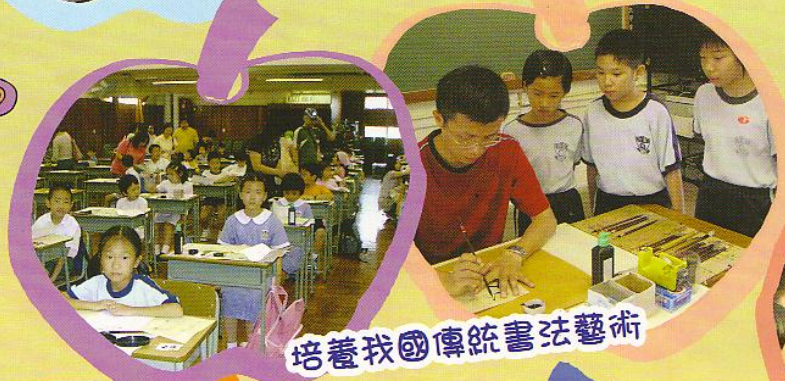
培養我國傳統書法藝術