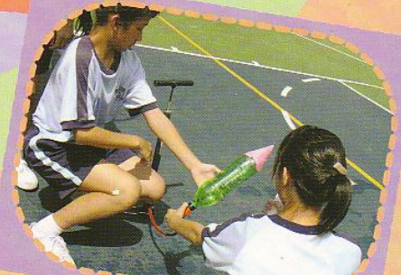
常識科科學探究活動—水火箭