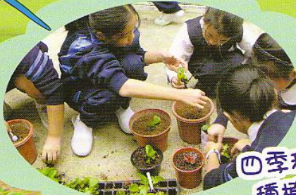
四季秋海棠種植比賽