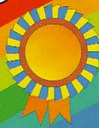
第三屆全港 微型小說創作大賽