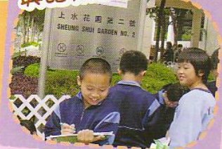
全方位學習 英語樂遊園