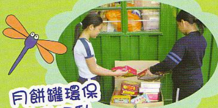
月餅罐環保回收活動