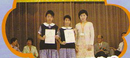
公益少年團頒獎典禮