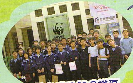
參觀米埔自然保護區