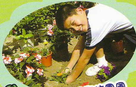
同學整理學校園圃